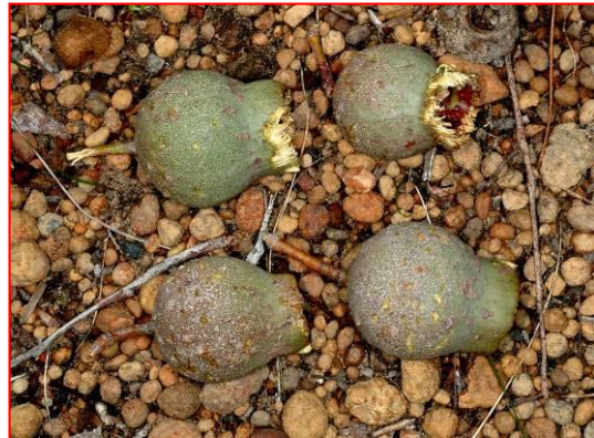
바우딘코카투가 먹은 Marri 열매